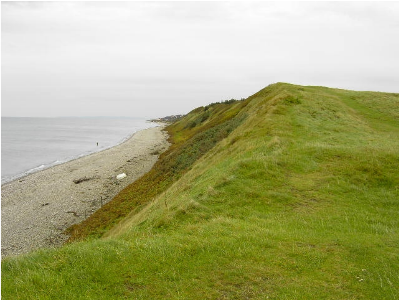
Heatherhill, som det ser ud i 2007. Raageleje skimtes længst væk i billedet